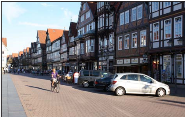
Schöne Fachwerkhäuser in der Celler Innenstadt

Die Celler Regatta – 500 Meter auf drei Bahnen – ist eher eine von den kleineren Wettbewerben. Dadurch hat sie aber eine sehr familiäre Atmosphäre. Man spürt überall das große Engagement der Vereinsmitglieder. Unsere Teilnahme 2012 haben wir deshalb auch schon wieder ins Auge gefasst.