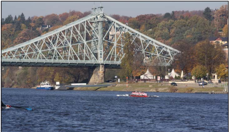
Kurz hinter dem Ziel beim Elbepokal: Das bekannte Blaue Wunder

Insgesamt waren neun Achter gemeldet. In unserer Altersklassen starteten sechs Boote. Der relativ enge Kontakt zu dem vorausfahrenden bzw. dem folgenden Boot erwies sich auch als motivierend für die Anstrengung jedes Einzelnen. Nach ca. 1000 Metern hörten wir Steuerbord ein Krachen und nahmen im Vorbeifahren wahr,