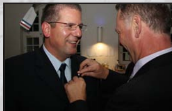
Ruderball mit Meisterehrung ... mehr auf Seite 16