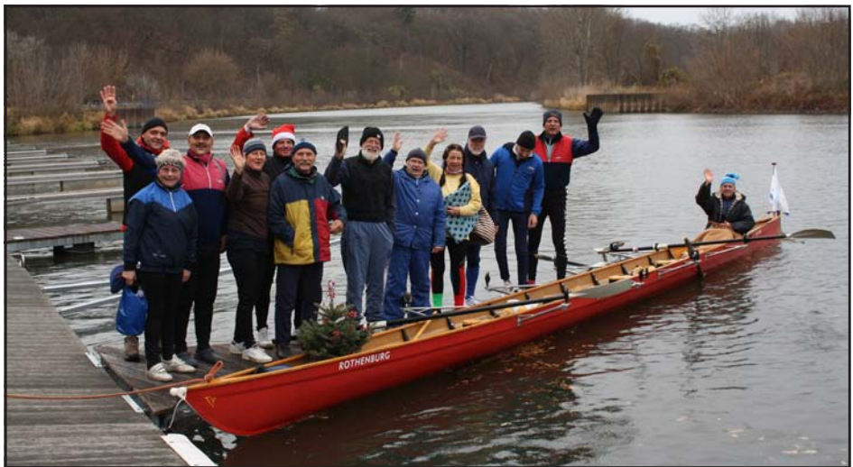
Die Teilnehmer der Lichtelfahrt am Steg in Salzmünde