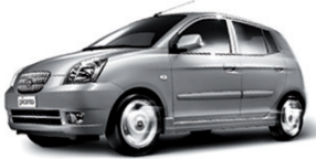
Abb. zeigt EX-Version.

Der neue KIA Picanto ist ein echter Hingucker. Nicht nur auf den ersten Blick. Mit seinem 1,1-Liter-Motor und 48 kW (65 PS), Front- und Seitenairbags, ABS, 5 Türen u. v. a. m. überzeugt er auf Anhieb, ehe er von innen zeigt, wie groß klein tatsächlich sein kann.