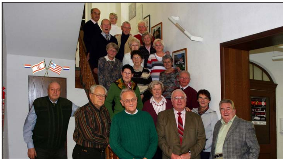
Gruppenfoto der Alten Herren im Ruderhaus Böllberg anlässlich ihres Jahrestreffens 2011